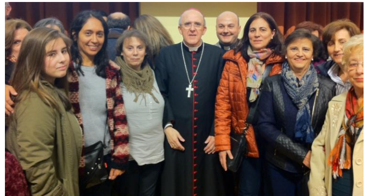
Arriba: EL Arzobispo de Madrid con los catequistas de la parroquia.