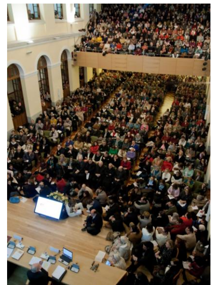
Derecha: Foto del Encuentro con los catequistas de la diócesis en el Seminario de Madrid