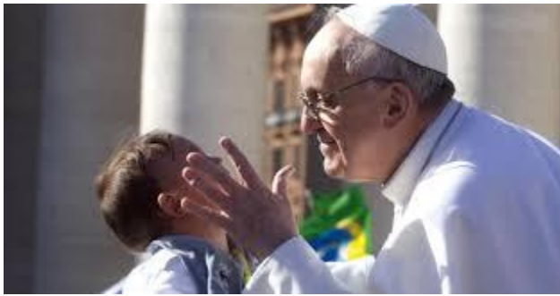
(viene de la semana pasada)