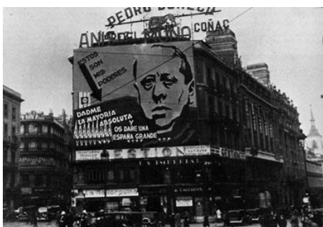
Cartel de propaganda electoral de la CEDA para las elecciones de 1936 con la efigie de Gil Robles

Pero la izquierda revolucionaria seguía con sus planes: gobernar. Pero se sabía que si esta izquierda revolucionaria llegaba al poder no se limitaría a gobernar, sino que trataría de implantar un nuevo orden revolucionario, destruyendo a sus enemigos. Durante el período de propaganda electoral anterior a la consulta del 16 de febrero, Largo Caballero, "el Lenin español", dijo claramente que la República no era sino una etapa hacia el nuevo régimen y que si el Frente Popular perdiese las elecciones, "tendremos que ir forzosamente a la guerra civil declarada". Largo Caballero quiso hacer en España lo que se hizo en Rusia: instaurar el socialismo marxista, logrando una sociedad sin clases. Por tanto, una clase debía desaparecer.