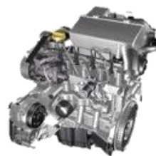
MOTOR de Fernando Alonso

Explicando tus hazañas a los hombres, la gloria y majestad de tu reinado. Tu reinado es un reinado perpetuo, tu gobierno va de edad en edad. R./