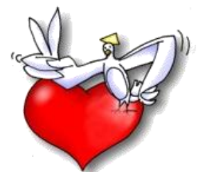
MOTOR de la Iglesia