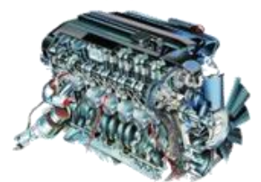
MOTOR de Schumacher