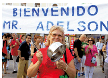
FRAN OTERO Publicado en Vida Nueva nº 2.807

El Obispado de Sant Feliu de Llobregat en Barcelona también lo cuestiona con consideraciones más contundentes como "el precio humano que exige para obtener un hipotético beneficio económico".